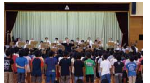
オーケストラと一緒に合唱する子どもたち (山形県酒田市立十坂小学校)

全国の小・中学校の体育館で、子どもたちに迫力ある生のオーケストラ演奏に触れる機会を提供する事業で、神奈川フィルの音楽による社会貢献の中核をなす非常に重要な公演となっています。